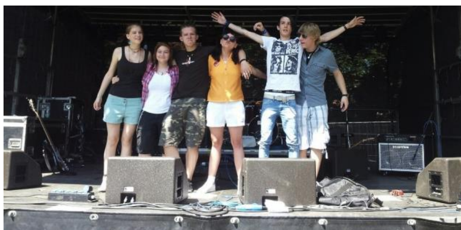
23. 06. 2012 Workshopy SA na United Islands + DJs + AkademiX

21. 06. 2012 Klubová noc v rámci United Islands DJs + Divadelní akademie + AkademiX + výstava fotografií a promítání filmů FA