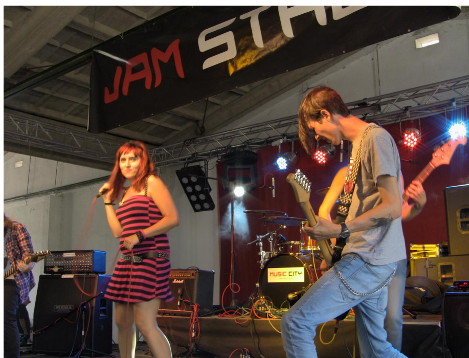
03. 08. 2012 AkademiX na Sázavafestu