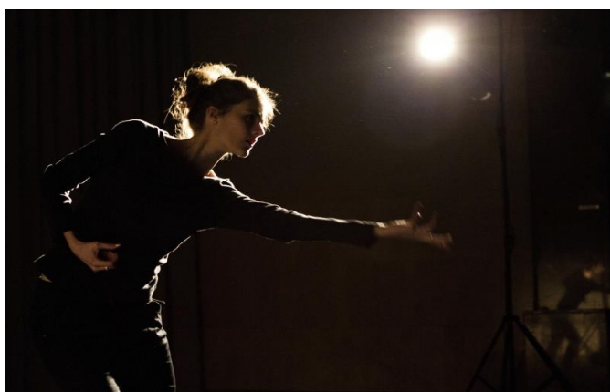
08. 02. 2012 Divadelní představení v rámci výročního setkání nadace Č