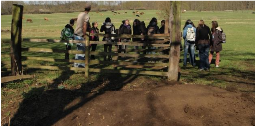
květen 2012 Výjezd do terapeutických komunit Sanimu