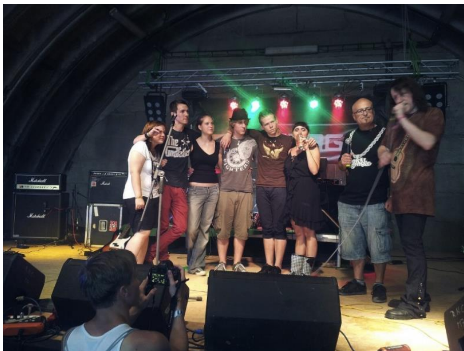
04. 07. 2012 AkademiX na Rock for people