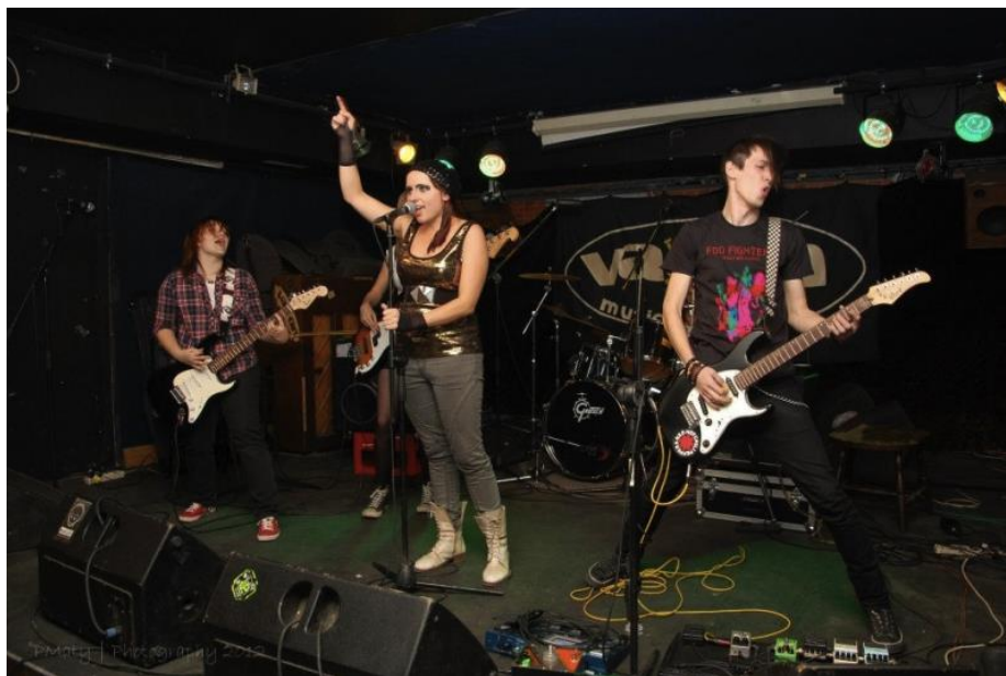
12. 11. 2012 Talenti a mistři: koncert AcademiX a Abraxas ve Vagonu

Rok 2012 byl z hlediska Studentských akademií velmi plodný. Naši žáci se prezentovali a účastnili mnoha kulturních a volnočasových zájmových akcí.