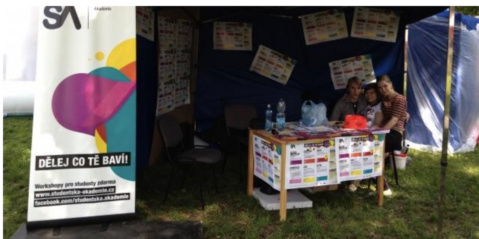
04. 05. 2012 Majáles - stánek SA