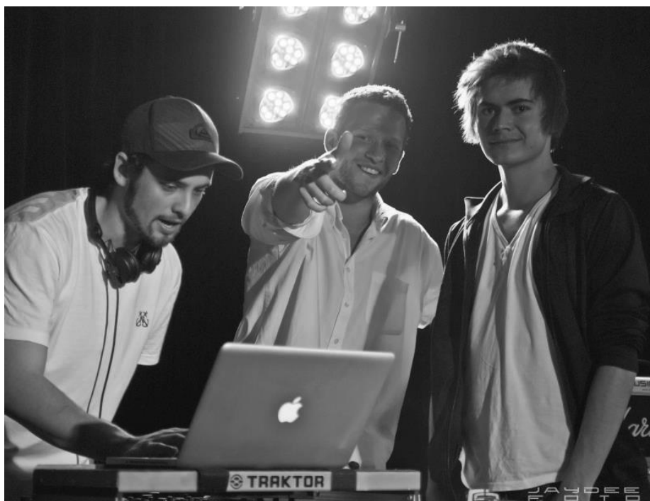
10. 05. 2012 Mejdán SA – Jam session AcademiX a The Highlights